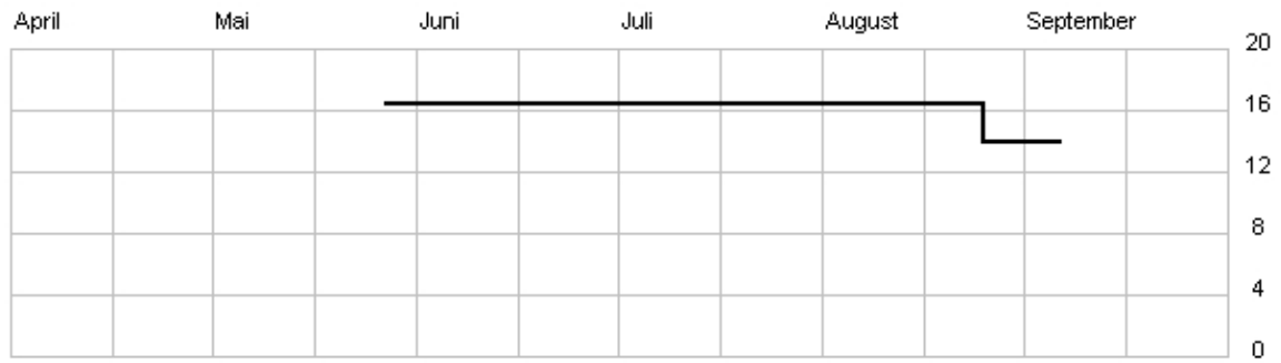
Preisentwicklung in %